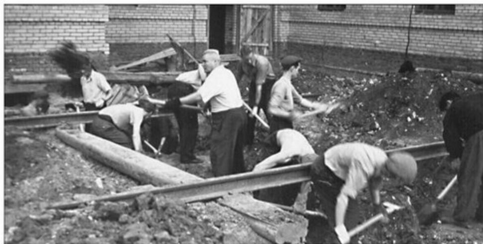
На строительной площадке университетского городка трудились и студенты, и преподаватели. 1950-е годы