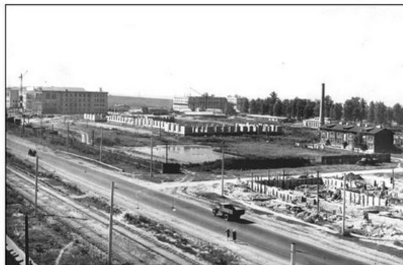
Строительство университетского городка. 1950-е годы