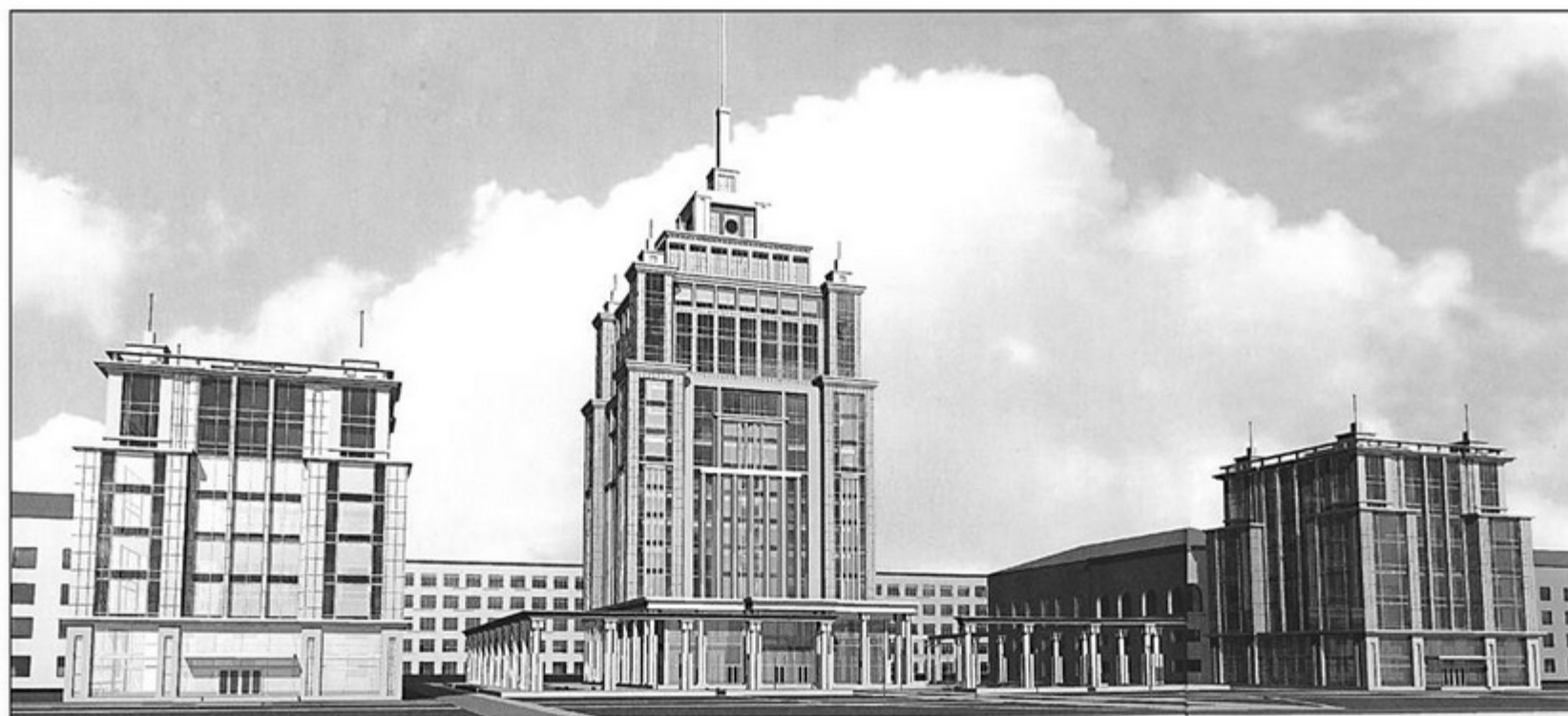
Проект здания университета. 2007 год