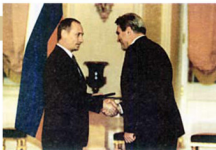
В.В. Путин вручает А.Ф. Хохлову Премию президента Российской Федерации в области образования. Декабрь 2000 года