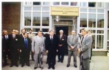
Ректор ИНГУ профессор А.Ф. Хохлов, вице-премьер Правительства РФ И.И. Клебанов, зам. министра промышленности и науки М.Л. Киршичиков и губернатор Нижегородской области Н.П. Скларов открывают инновационно-технологический центр университета. Сентябрь 2000 года