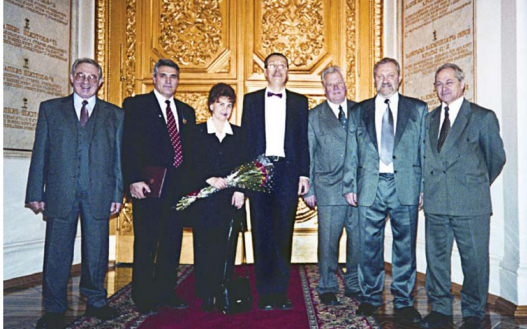
Лауреаты премии Президента РФ в области образования. 2000 год

В 1990–2002 годах в ННГУ были созданы 8 новых факультетов: