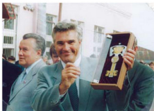
Торжественное открытие Второго факультета дистанционного обучения в г. Павлове. Вручение символического ключа ректору ННГУ А.Ф. Хохлову (слева) – губернатор Нижегородской области Н.П. Складов, 2 сентября 2000 года

На 17 факультетах обучалось 15 000 человек.