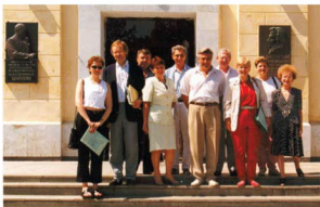
Встреча сотрудников ННГУ с делегацией университета Пьера-Мендеса Франса (г. Гренобль, Франция)

Российско-итальянский университет (1997) стал уникальным международным проектом, реализующим новые принципы интеграции российской высшей школы в европейское пространство. Он объединил Нижегородский государственный университет им. Н.И. Лобачевского и калабрийский Университет (Козенца, Италия).