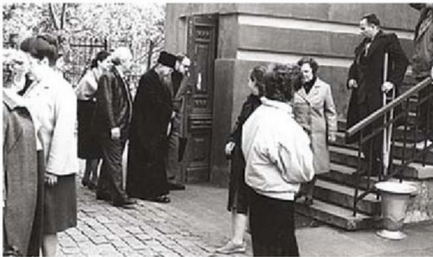
Посещение Литературно-мемориального музея Н.А. Добролюбова митрополитом Нижегородским и Арзамасским Николаем (Кутеповым). 1988 год