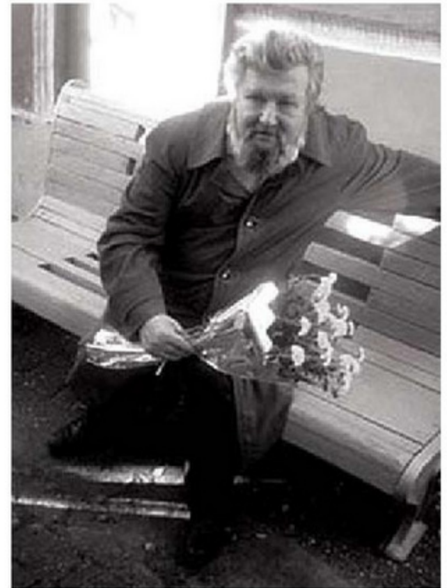
В добролюбовской усадьбе создана новая традиция: открыта мемориальная скамейка поэта Юрия Адрианова. 20 октября 2000 года

Музей Добролюбова замечательный еще тем (что не всегда бывает в музеях старинных), что он воспроизводит эмоциональную атмосферу жизни Добролюбова. Он очень хорошо сделан. Поздравляю, желаю дальнейших успехов. Д.С. Лихачев 31.05.87